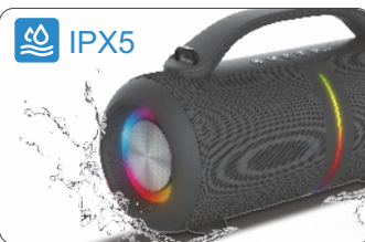
Waterproof Grade: IPX5