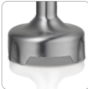
Extra resistant stainless steel foot Pé extra resistente em aço inoxidável Pie extra resistente de acero inoxidable Pied extra résistant en acier inoxydable