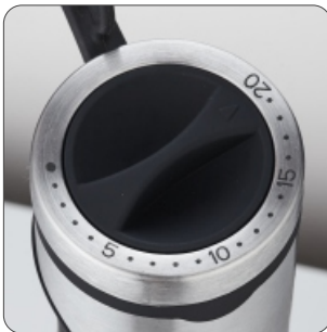
Progressive speed control Controlo progressivo de velocidade Control de velocidad progresivo Contrôle de vitesse progressif