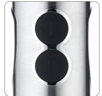
2 Easy-touch power switches 2 Interruptores de velocidade 2 Interruptores de velocidad 2 Interrupteurs de contact facile