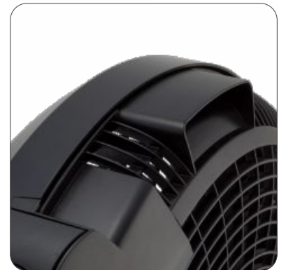
Carrying Handle Pega de transporte Asa de transporte Poignée de transport

Taxa de fluxo máxima / Caudal máximo del ventilador:..... 64.3 m 3 /min Valor de serviço / Valor de servicio:..... 1.15 (m 3 /min)/W Nível de ruído / Nivel de ruido:..... 65.0 dB(A) Velocidade máxima do ar / Velocidad máxima del aire:..... 2.7 meters/sec Norma de medição para o valor de serviço:..... IEC60879:1986+ (corr.1992)