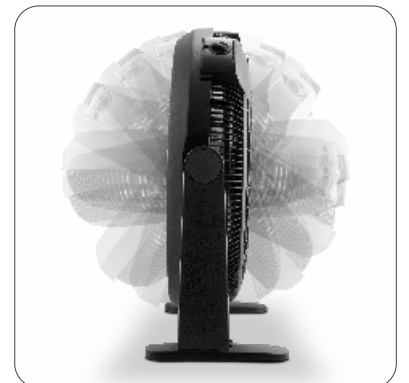
180° Tilt adjustment Função de inclinação de 180° Función de inclinación de 180° Fonction réglage de l'inclinaison 180°