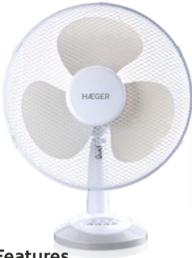
Table Wind FA-016.007A